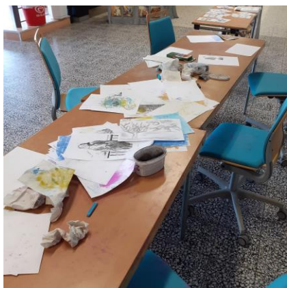
Barn älskar att teckna! Från Familjedag på Axevalla 2022.

Mina erfarenheter gör också att jag lärt mig att anpassa aktiviteterna till olika deltagare. För att aktivera barn räcker det ofta att lägga fram några kriterier, men man måste vara uppmärksam och ha nya uppgifter på lager ifall de tröttnar. På ett demensboende kan det ta flera arbetspass innan jag förstår hur jag kan nå fram till och aktivera just den brukaren.