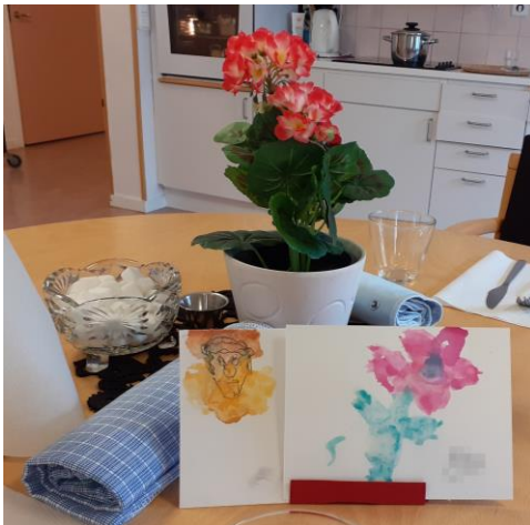
Måla med en konstnär 2022: Deltagare inom äldreomsorgen sprider glädje på avdelningen med sina verk!

Min förmåga att behålla en överblick är ofta värdefull i sammanhanget – när jag arbetar som kreativ ledare cirkulerar jag mellan deltagarna och försöker se till att hela gruppen aktiveras. Det gör att varje deltagare känner sig uppmärksammad och får ut något av passet samtidigt som gruppdynamiken blir bättre.